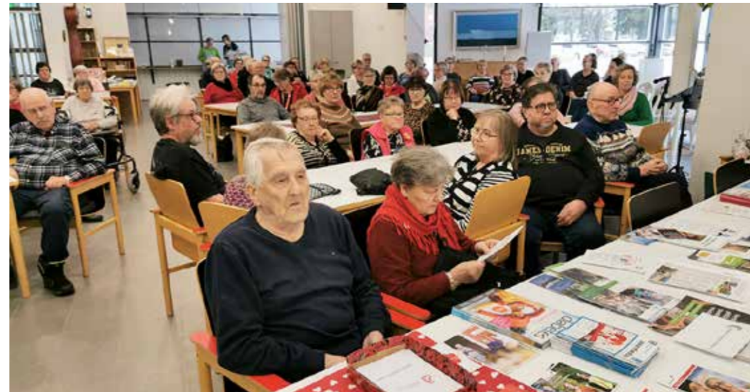
Ilmajoen Kotokartanon yleisötilat täyttyivät tiedonjanoista kuulijoista, kun Kotopysäkki-yhteisö järjesti viihteellisen tapahtuman, jossa kuultiin paikkakunnalla toimivien sote-yhdistysten, seurakunnan ja Kehittämisyhdistys Liiverin terveysalan palveluista.