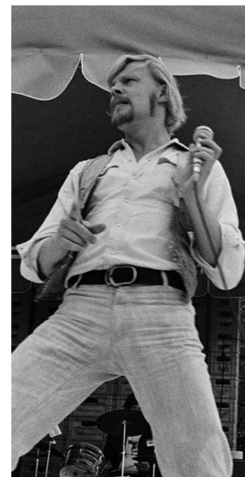
Vesa-Matti Loiri.

– Tuo oli hyvin sanottu. Lisäksi mukana voi olla muunmaalaisiakin vaikutteita, kuten työväenlauluja tai muita vasemmiston lempilauluja eri puolilta maailmaa. Esimerkiksi Teodorakisin, Vysotskin ja Brelin musiikkia on tullut kuultua.