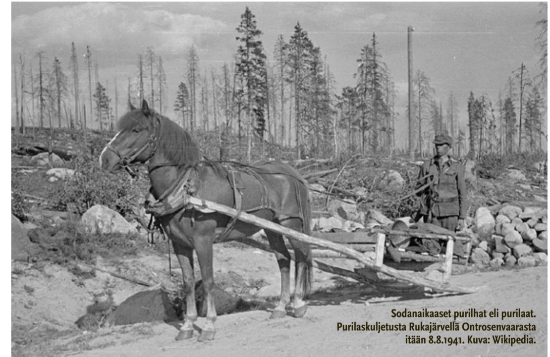
Sodanaikaaset purilhat eli purilaat. Purilaskuljetusta Rukajärvellä Ontrosenvaarasta itään 8.8.1941.