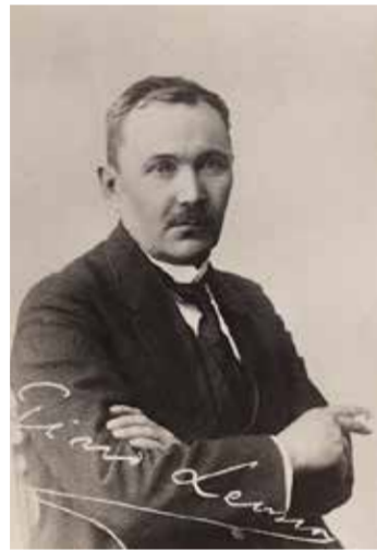
Eino Leino.

Vesa-Matti Loiri oli jo aiemmin laulanut levyllä Kai Chydeniuksen säveltämät Nocturnen ja Lapin kesän.