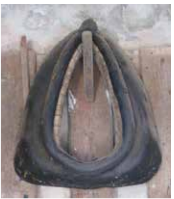
Ränget tai länget.

Kokosi: Toive Tynjälä, tiedottaja EKL:n Pohjanmaan piiri