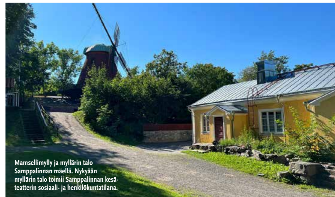
Mamsellimylly ja myllärin talo Samppalinnan mäellä. Nykyään myllärin talo toimii Samppalinnan kesäteatterin sosiaali- ja henkilökuntatilana.