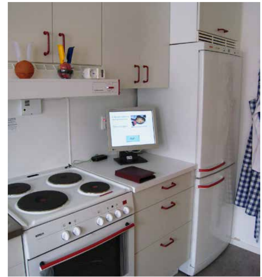
Punaiset vetimet erottuvat hyvin.

Lisätietoa esteettömyydestä antaa: www.invalidiiliitto.fi > Esteettömyys > Esteettömyyskeskus ESKE Edellisestä Eläkkeensaaja-lehdestä 4/2022 sivulta 10 löytyy tietoa korjausneuvonnasta ja korjausavustusten hakemisesta.