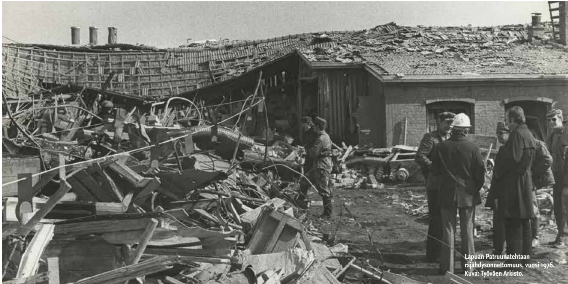
Lapuan Patruunatehtaan räjähdysonnettomuus, vuosi 1976.