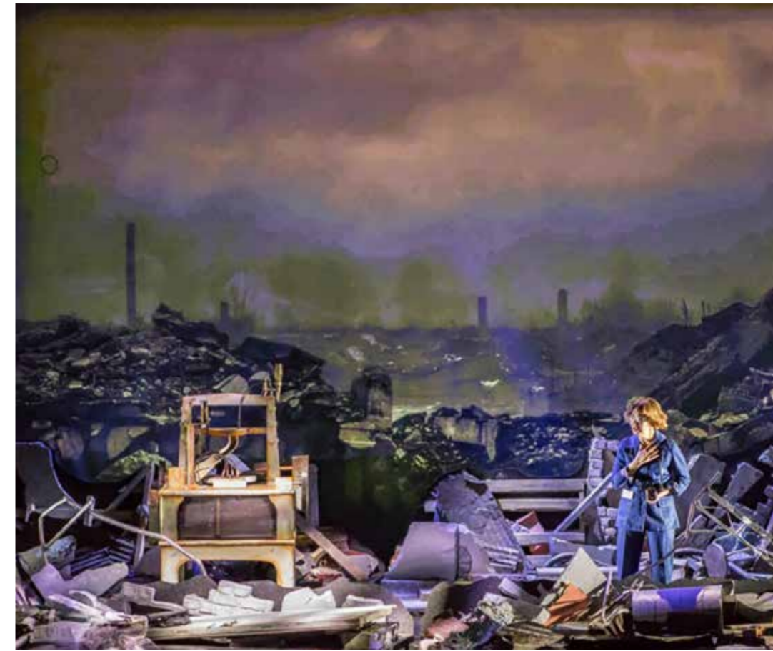
Seinäjoen kaupunginteatteri.

Suru ja kaipausta, odotuskin on perheessä jokapäiväistä,