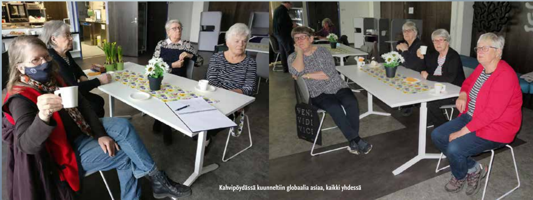
Kahvipöydässä kuunneltiin globaalia asiaa, kaikki yhdessä

Saimme kuulla Nakkilan liikuntakeskuksella painavaa asiaa. Yleisö seurasi alustusta keskittyneenä ja vakavana. Olemme niin laajan ongelman edessä, että enää ei auta maastopalon tai edes oman talon sammuttaminen. Lyhyesti: koko maailma on jo liekeissä ja matkalla tuhoon.