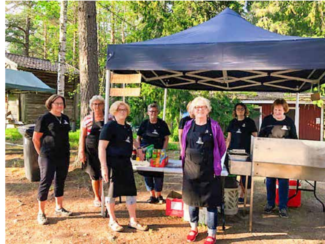
Kesäteatteritarjoiluja on viimeksi päästy kattamaan vuonna 2019 (kuva tuolta vuodelta), joten myös buffet-aktiivit odottavat tulevaa kesää innolla.

"Oli kerran aika, jolloin Suomessa oli enemmän kisälliryhmiä kuin rautalankayhtyeitä. Kisällilaulu on kuitenkin tyhjä läiskä musiikin kartalla, sen historia on odottanut tekijänsä. Timo Tuovinen on paras työväen musiikkiperinteen tuntija maassamme. Hänen tutkimustaan kisällilaulun historiasta on odotettu kauan. Nyt se on tässä!"