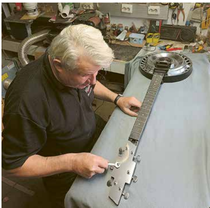
Yksi perheen pojista harrastaa Ameriikan autoja. Hän pyysi valmistamaan sähkökitaran, jossa on Chevroletin pölykapseli kannessa ja lapaviiluna Chevroletin logo. Sellainen onkin jo valmistumassa Pentin taitavissa käsissä.

Teksti: Toive Tynjälä