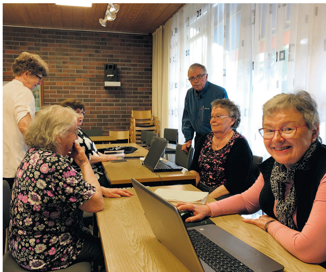
Iloisia oppijoita ja opastajia Verkosta virtaa Elämispäivillä Yläneellä.