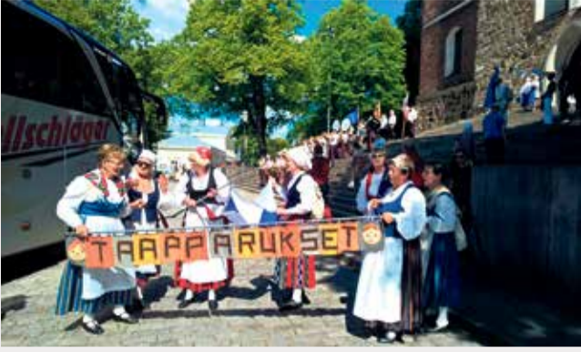
Kesällä 2017 Taapparukset esiintyivät Europeade-kansantanssitapahtumassa Turussa. Osallistuimme myös kulkueeseen, kuvassa juuri lähdössä kulkueeseen.