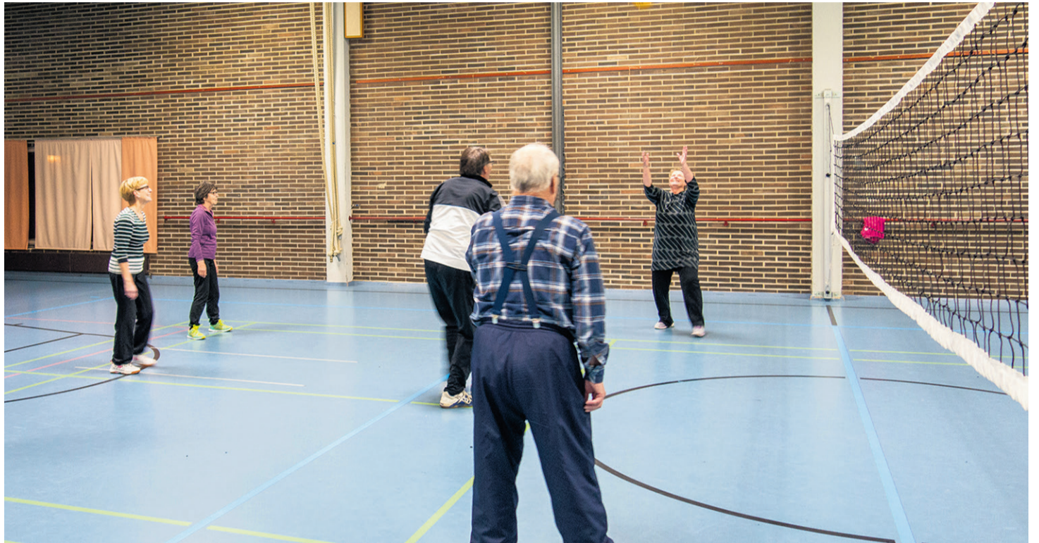
Hentopallo on uusi kiva laji palloilupeleistä pitävälle, sallivampi kuin lentopallo. Pallokin on pehmeämpi.

Yksi EKL:n tavoitteista on aina ollut ikäihmisten fyysisen kunnon ylläpitäminen. Tuo tavoite on saavutettu yli odotusten, sillä monipuoliset liikuntamuodot ovat vakiinnuttaneet asemansa EKL-yhdistyksissä ympäri Suomen. Kun yksi liikuntamuoto menettää kiinnostustaan, keksitään uusia.