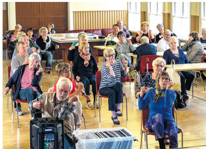
Näin nautitaan liikunnasta lavatanssimusiikin tahdissa.

Myöskään 25 kilometrin matka Paimiosta harrastuspaikkaan, Salon Hanhivaaran keilahallille, ei ole este.